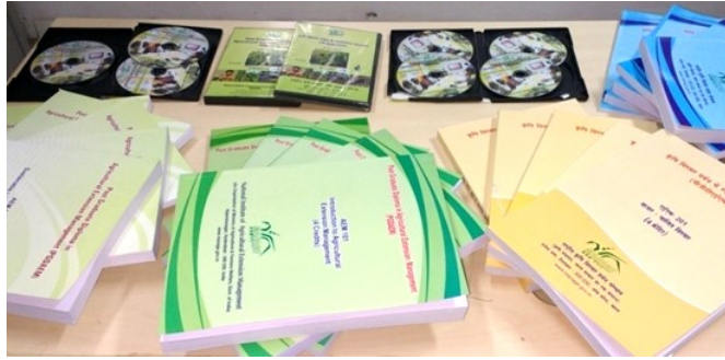
‘विस्तार व्यवस्था में व्यावसायिकता को प्रोत्साहित करना’

बारहवीं पंचवर्षीय योजना के दौरान देश में विस्तार कर्मियों की अनुमानित संख्या 1,30,000 है, जो कृषि एवं तत्संबंधी क्षेत्रों में जिला एवं ब्लाक स्तरों पर कार्यरत है। विस्तार विकास कर्मियों को कृषि एवं तत्संबंधी क्षेत्रों में इच्छित परिवर्तनों को लाने के लिए औत्साहिक और उपयोगी ज्ञान के स्रोत के रूप में परिवर्तित करना होगा। भारत में कि विद्यमान विस्तार कर्मियों की क्षमता को मजबूत एवं वृद्धि करने की आवश्यकता है जिससे माप और भिन्नता के आधार पर मेल हो सके।