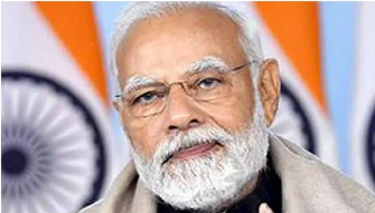
Prime Minister Narendra Modi while speaking on a Mann ki Baat programme

The National Institute of Rural Development and Panchayat Raj (NIRDPR) will release the findings of a study on the impact of Prime Minister Narendra Modi's Mann Ki Baat