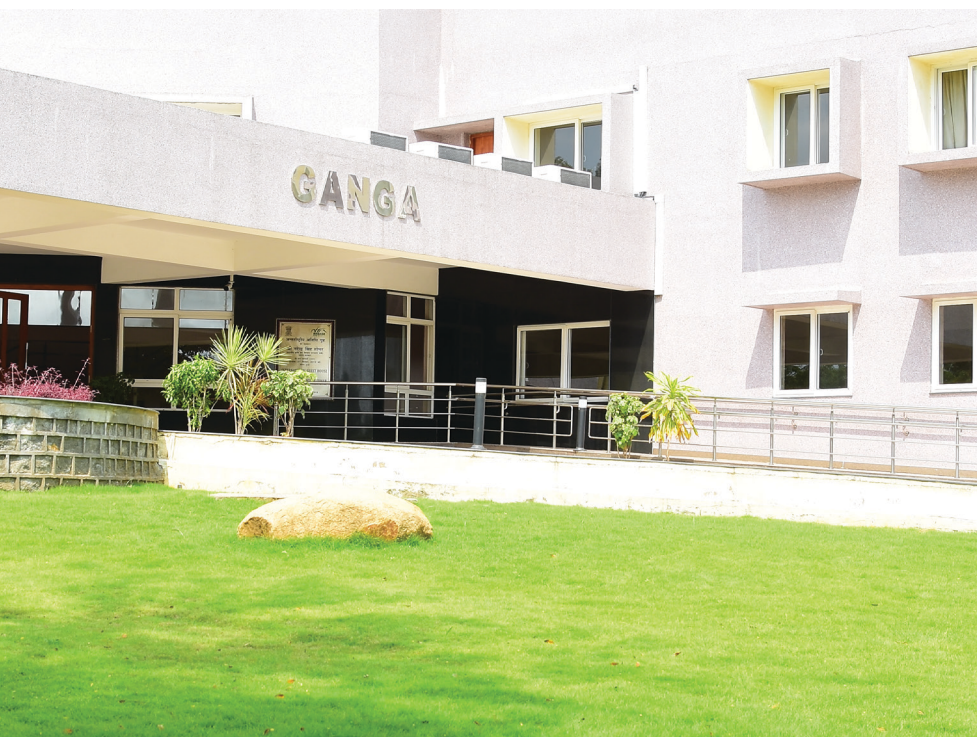
GANGA INTERNATIONAL GUEST HOUSE