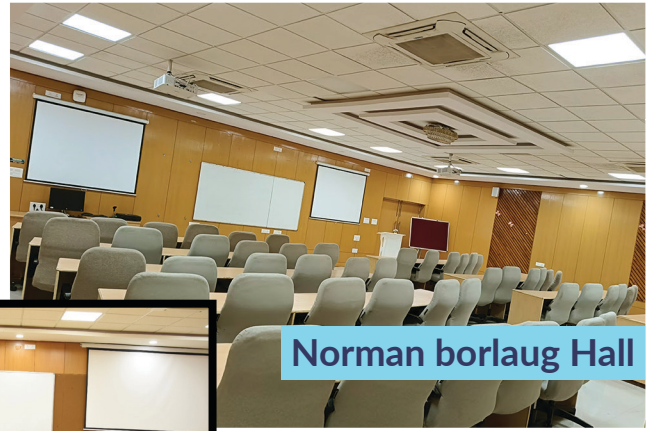
Norman borlaug Hall