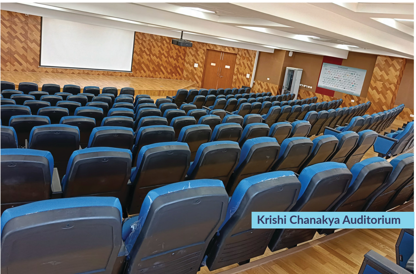
Krishi Chanakya Auditorium