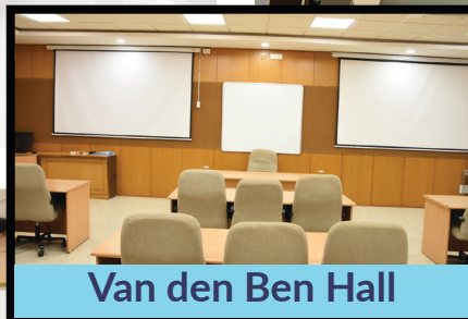
Van den Ben Hall