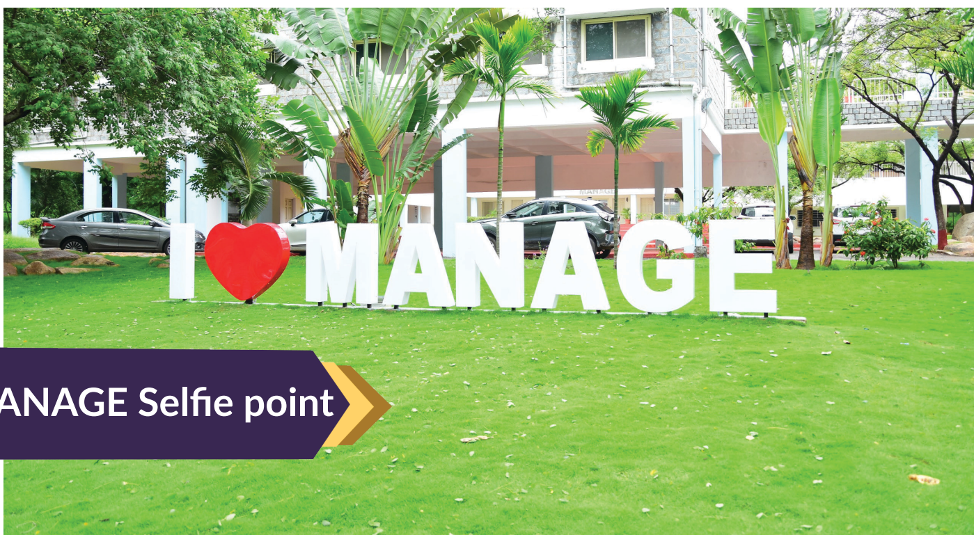
MANAGE Selfie point