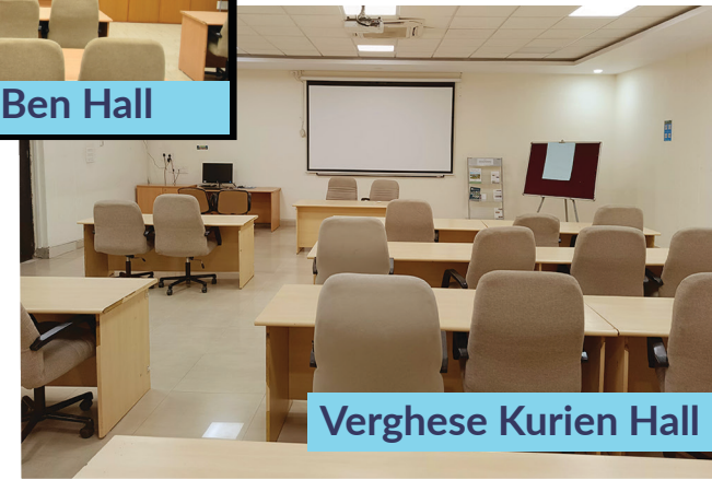
Verghese Kurien Hall