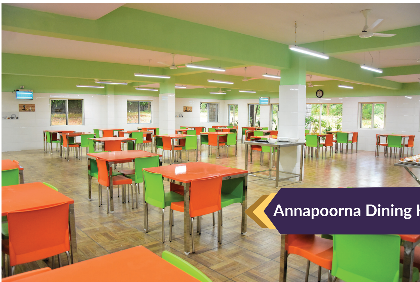
Annapoorna Dining Hall